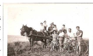
Sortie en famille en 1946