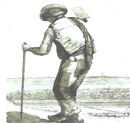
Gravure d'un agriculteur avec sa bouelle sur l'épaule

A la fin du 19 ème siècle les ressources alimentaires des insulaires rétais sont principalement issues de la mer avec le sel et la pêche sur l'estran, la terre avec le blé, la vigne. La nourriture des rétais est quasiment la même et des plus frugales dans tous les villages. Le pain fabriqué dans les sociétés de panification est la base de leur alimentation ce qui explique le nombre de moulins à vents construits sur l'Île de Ré estimé à plus d'une centaine. En 1890 il n'y a plus qu'un moulin actif dans le canton sud alors qu'il y en a encore 21 dans le canton nord.