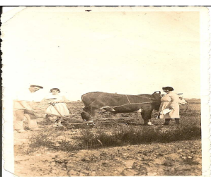
Couple de jeunes cultivateurs labourant un champ avec le