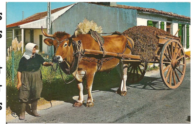
Cultivatrice partant au champ porter le sart

Aujourd'hui la tendance des consommateurs, dont les touristes, serait d'acheter les produits de la ferme « légumes et fruits maraîchers, bio » en vente directe si les prix affichés sont compétitifs correspondant aux prix du marché.